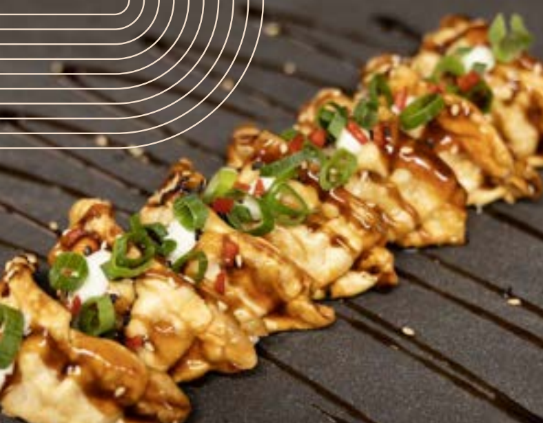
GYOZAHAPJE per set (7 stuks) €7,95