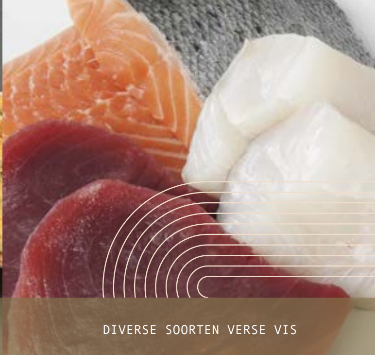
DIVERSE SOORTEN VERSE VIS