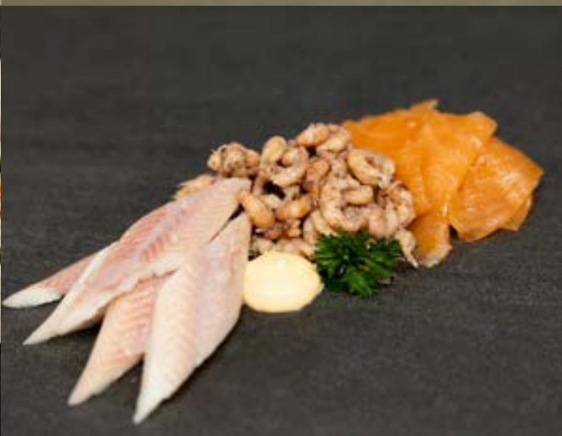
LUXE TRIO €9,50 per portie