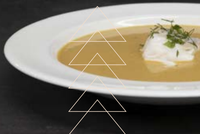
BRETONSE VISSOEP €6,95 1/2 liter