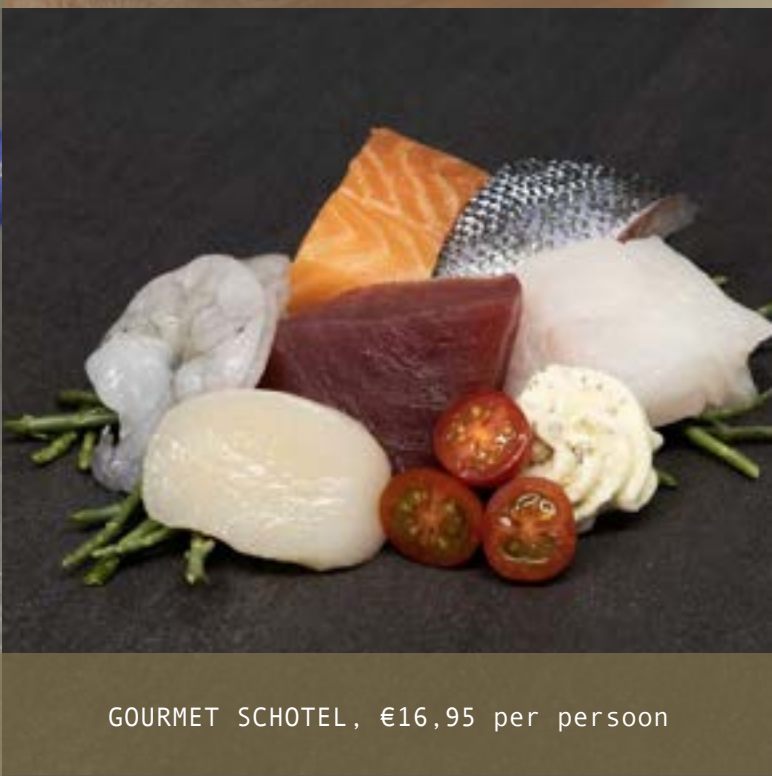
GOURMET SCHOTEL, €16,95 per persoon