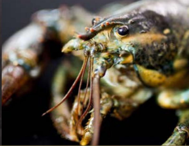
VERSE KREEFT (dagprijs)