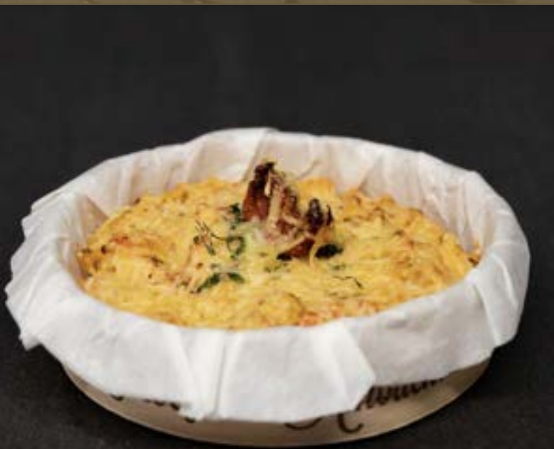
KRAB DIABLE groot €6,25 | klein €3,95