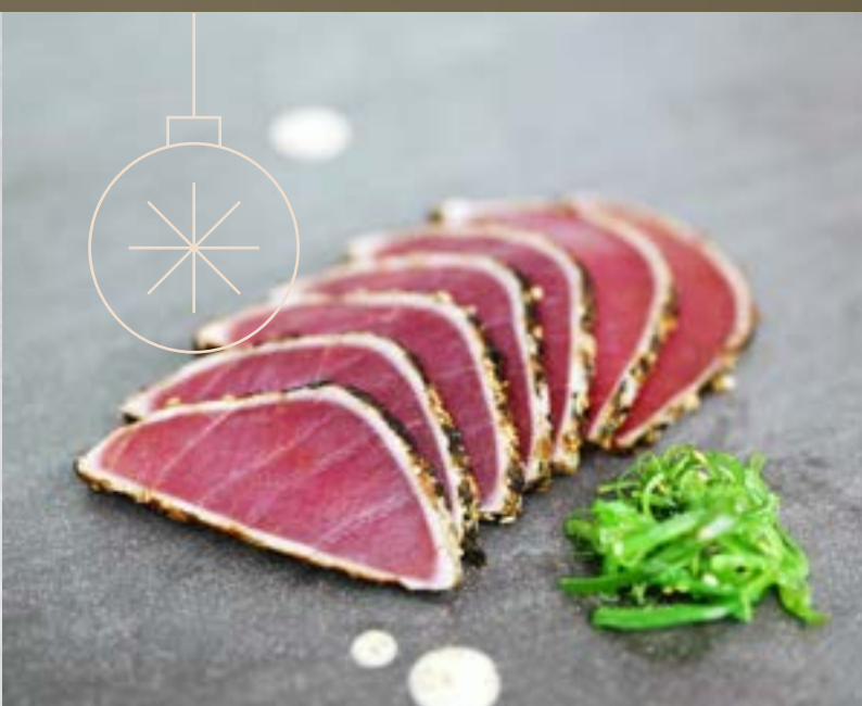
TONIJN TATAKI €9,50 per portie