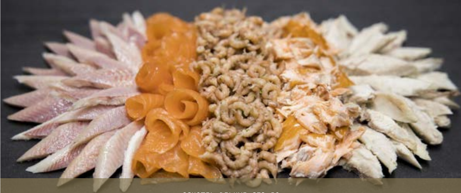
SCHOTEL DELUXE €72,50