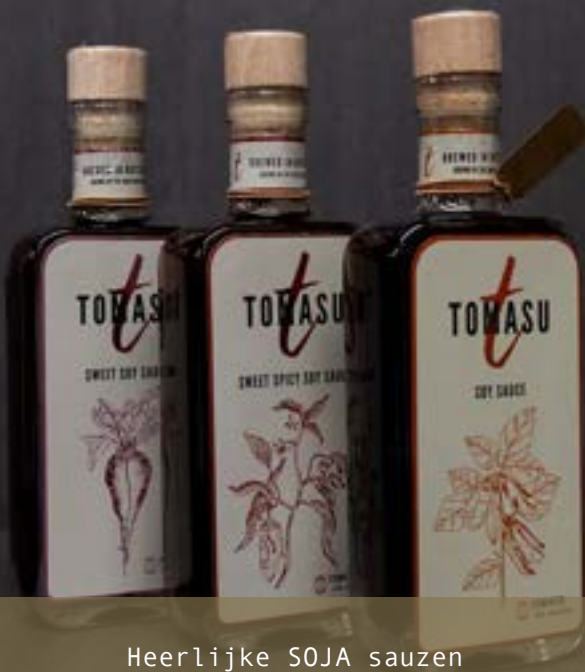
Heerlijke SOJA sauzen