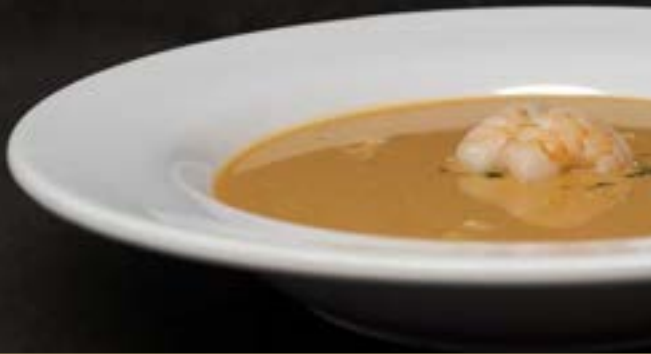
KREEFTENSOEP €6,95 1/2 liter