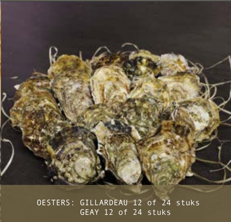
OESTERS: GILLARDEAU 12 of 24 stuks GEAY 12 of 24 stuks