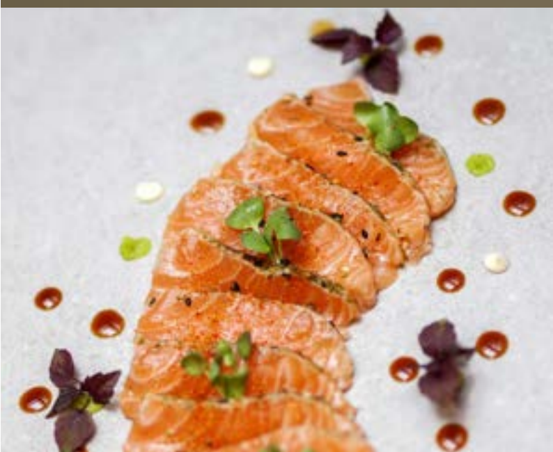
ZALM TATAKI €7,95 per portie