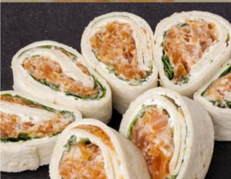
ZALMWRAPS €3,95 per stuk