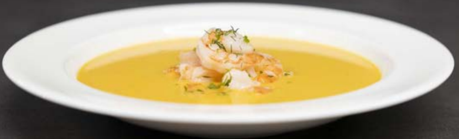
POMPOEN GAMBA SOEP €6,95 1/2 liter