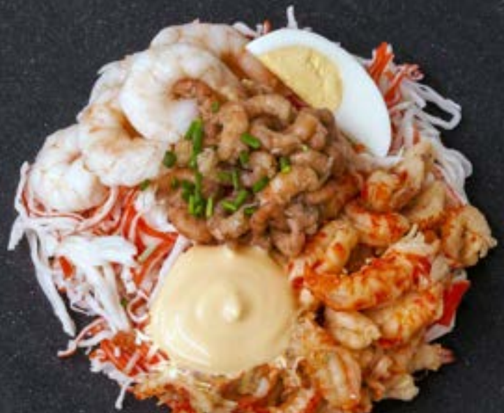
LEIDSE COCKTAIL €3,95 (2 voor €7,50)